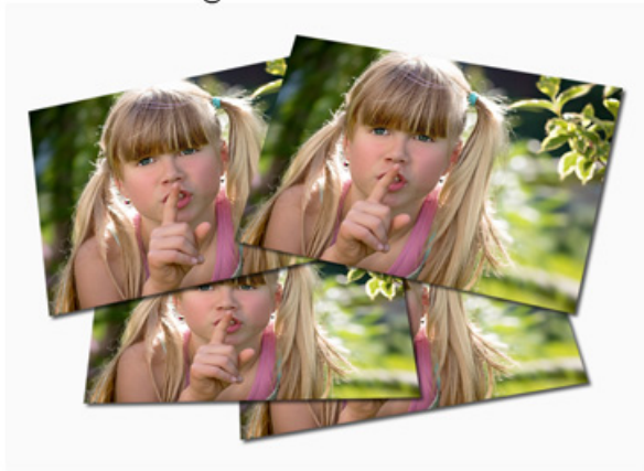
Magnete 4er Set